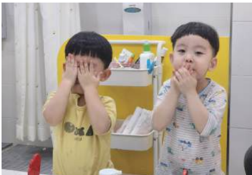
스스로 세수하는 영아