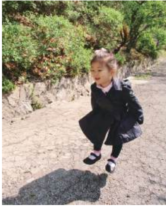
두 발 모아 뛰기를 하는 영아 (이동 운동)