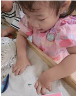
“꼭꼭 숨어야 해. 상어가 쫓아오고 있어.”