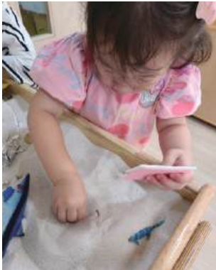
“새우야, 모래 속에 들어가 있어.”