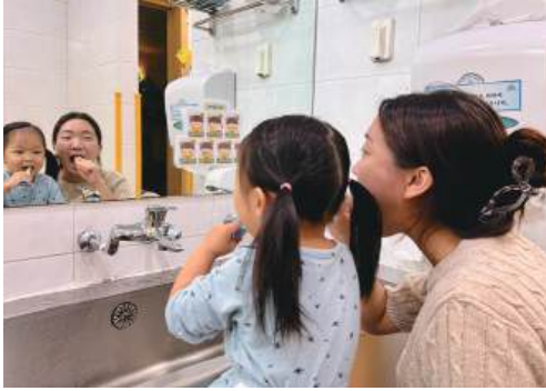
식사 후 교사와 함께 즐겁게 양치질을 시도하는 영아