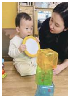
물체를 입으로 가져가 빨며 촉감을 느껴 보는 영아