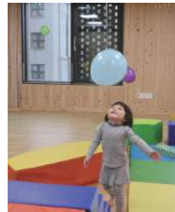
대근육 기구에서 놀이하는 영아