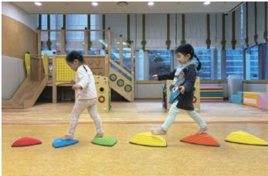
즐겁게 징검다리 건너기를 반복하는 2세 영아