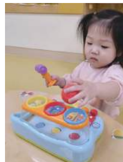
소리 나는 놀잇감을 반복적으로 누르는 영아