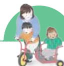
모든 영아를 위한 지원자료