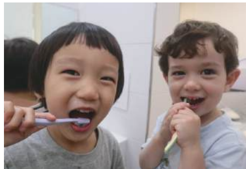
스스로 양치하는 영아