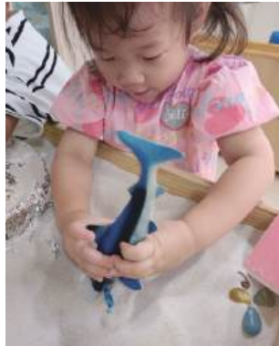
“남남남. 새우를 먹어 버릴 거야.”