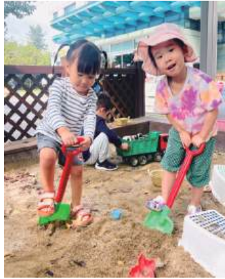
허리와 다리를 구부렸다 펴며 삽질을 하는 영아(비이동 운동)